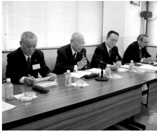
「優良タクシー運転者乗り場」をきっかけに、個タク業界のレベルアップを

禁煙化につき、個タクはステッカー貼付など禁煙に対して全面的に取り組んでいないのでは、という声もあります。徹底しなければ「東京では吸えるのに」と近県に影響が出ることもあります。非禁煙車が10%いた