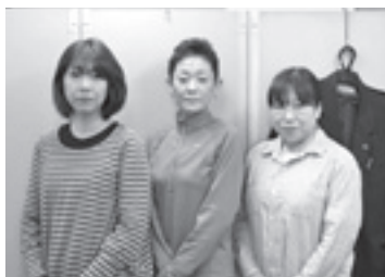
事務員のみなさん