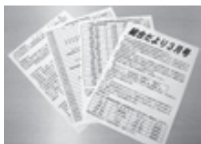
中澤専務理事が作成を担当し、月1回発行される「組合だより」