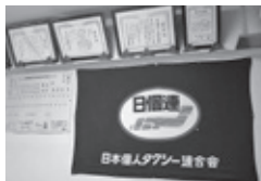
応接室に飾られた日個連の旗と賞状たち