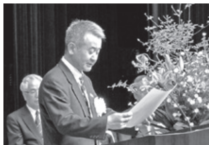
式辞を述べる原局長

本年8月、関東地域事業用自動車安全対策会議を開催し、安全体質の確立、コンプライアンスの徹底、飲酒運転撲滅と平成25年度関東地域事業用自動車安全施策実施目標を定め、官民一体となって事故防止の取り組みを推進しているところです。今後とも利用者の信頼に応えていくためには、安全安心な公共輸送機関としての基本的な役割を果たし、さらに環境対策など社会的