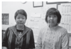
「皆さん、決していばらず優しい方ばかりですよ」とスタッフの皆さん